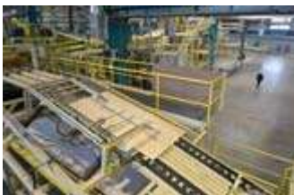
Furnierverklebung und Furnierlegung