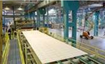
Furnierlage auf dem Weg in die Weiterverarbeitung