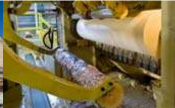
Schälen der Furniere Verarbeitung eines Stammes in 3 Sek.