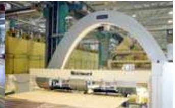
Grenzbach Trockner und Furniersortierung