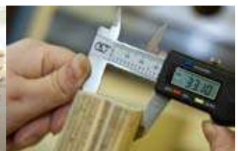
Qualitätskontrolle nach europ. Anforderungen

In der Nähe von Moskau (Russland) hat Taleon Terra die weltweit modernste Produktion für Furnierschichtholz errichtet. Aktuellste Anlagentechnik und internationales Ingenieurs Know how garantieren eine gleichbleibend hohe Produktqualität.