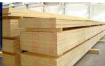
Plattenware nach der Presse