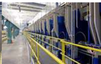
Die derzeit längste Dieffenbacher Presse der Welt